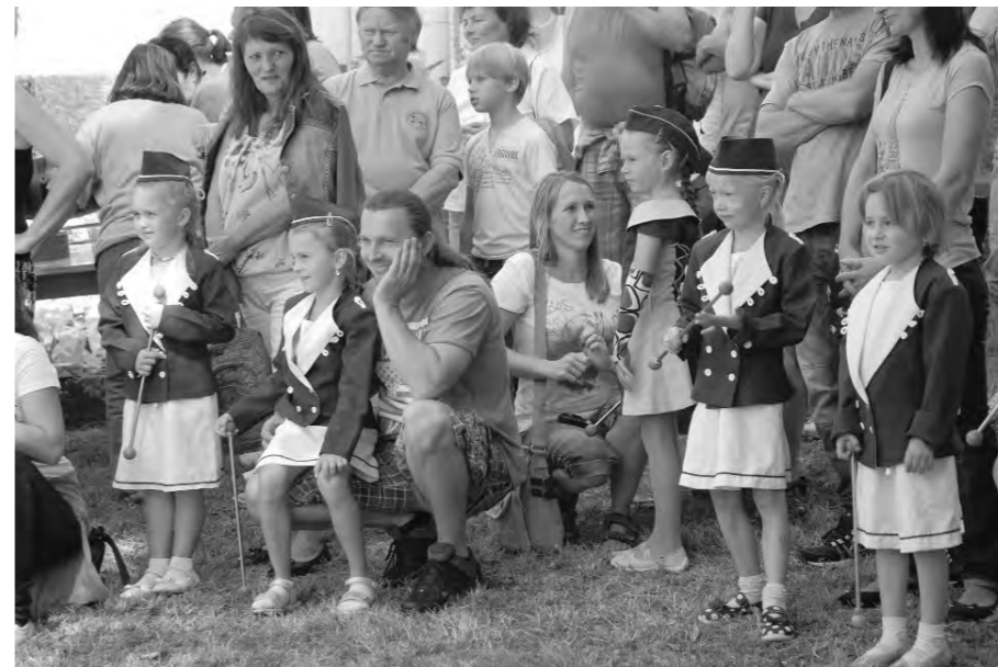
Nečtinské mažoretky před vystoupením na Bartolomějské pouti.

V jedenáct hodin začala mše, kterou vedl pan Martin Sedloň. Venku byly připravené lavice a stoly pro návštěvníky. Po mši se začali sjíždět veteráni. Byly to nádherné vozy a jeden z nich patřil panu Uhlířovi,