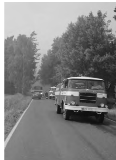
Velitel zásahu zažádal o vrtulník s bambivakem, www.hzscr.cz/10-8-2015-pozar-pole-a-lesa-horni-hradiste.aspx

V důsledku mimořádně suchého průběhu počasí v letošním létě nás provázely některé neblahé události. Jednak se začal projevovat alarmující úbytek vody v podzemních i povrchových zdrojích, se všemi negativy, které nedostatek srážek přináší a jednak se velmi zvýšilo nebezpečí vzniku požárů. Tento stav ohrožení znovu poukázal na nezbytnost a důležitost práce hasičů. A to jak profesionálních, tak i těch dobrovolných. Chtěl bych v těch-