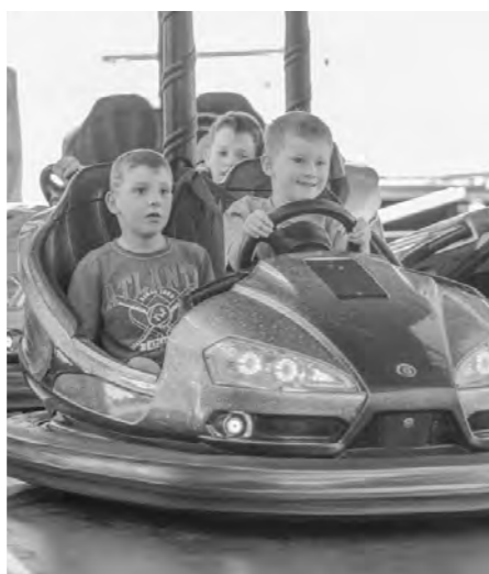
Atrakce v plném proudu.

Děti mohly střílet z luků, zkusit svíčkařské řemeslo nebo se těšit z jízdy na nových atrakcích. K mání nebylo jen pivo, ale i víno z Moravy, výborné maso od Karásků, palačinky, koláče, marmelády, trdelníky, klobásy a další pochutiny. Mezi prodejci bylo velmi pěkné a zajímavé zboží, které upoutalo nejedno ženské oko.