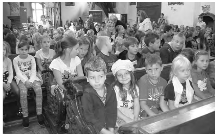
Děti na Procházkách uměním v kostele sv. Jana Křtitele v Manětíně.

Obec žila 21. pivními slavnostmi a Anenskou poutí na konci července. Velké přípravy předcházely celé akci, do které se zapojili i fotbalisté Nečtin, kteří se již po několikáté podíleli na organizaci.