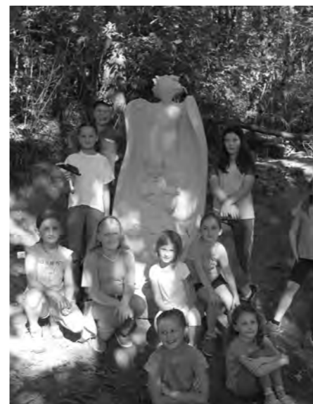
Komentovaná prohlídka Cesty andělů.