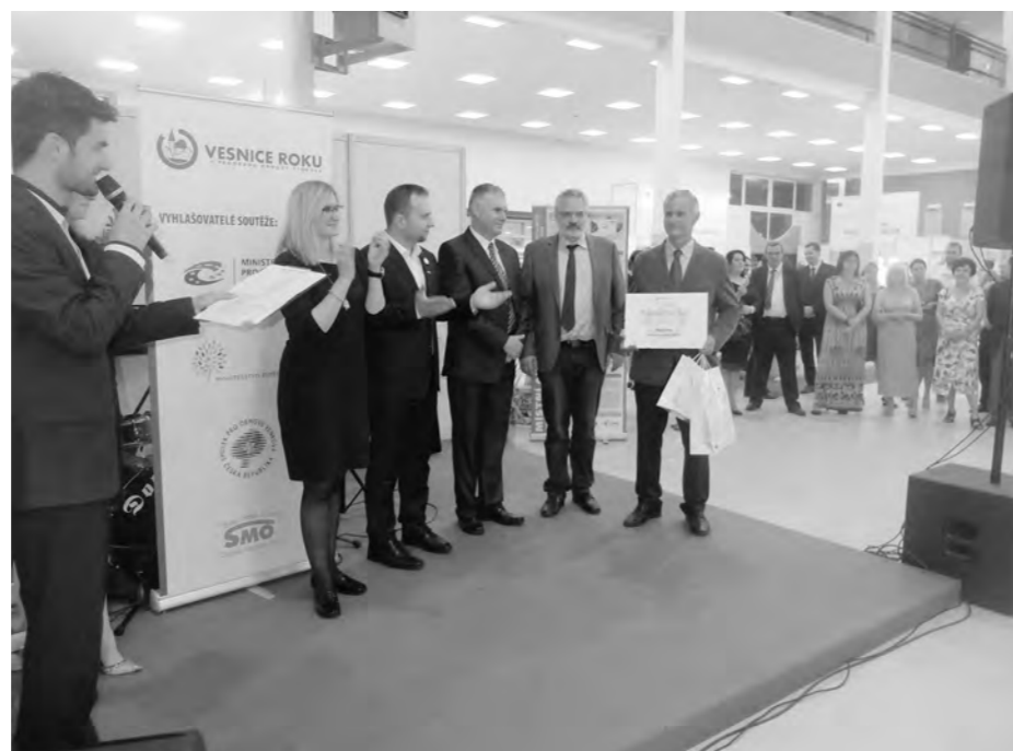
Starosta obce Nečtiny přebírá pamětní list.