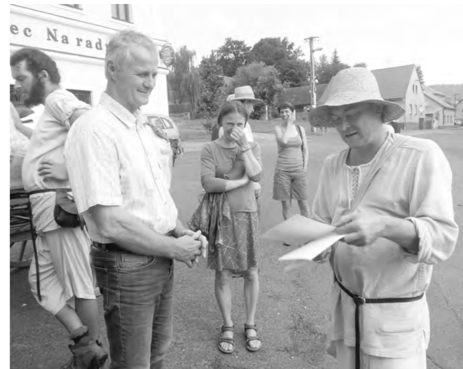
Starosta obce přebírá Glejt Husovi pouti.

Co je to pout' Nejsou to kolotoče a houpačky, ale putování. V minulosti se mnoho lidí vydávalo na cestu. Alespoň jednou za život tak poutníci putovali do Říma, Compostely či dokonce Jeruzaléma. Poutník na této cestě zažíval útrapy zimy, prázdného žaludku a únavy. To vše mu však přinášelo odměnu v podobě duchovního zážitku a očisty – šel, aby našel sám sebe. Možná dnešnímu poutníkovi nekručí už tolik v žaludku, ale pocity, které prožívá, jsou v podstatě stejné s těmi 600 let starými. V dnešní