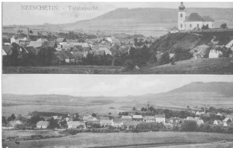
Pohled na Nečtiny z roku 1905–1920