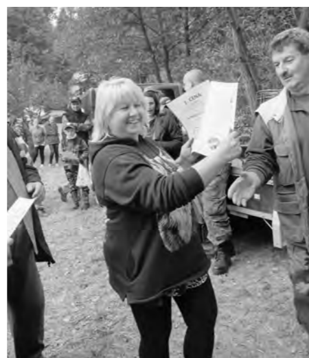
Kamčátka zase zvítězila.

Sbor dobrovolných hasičů Nečtiny ve spolupráci s obcí Nečtiny připravili již tradiční podzimní Rybářské závody dne 26. 9. 2015.