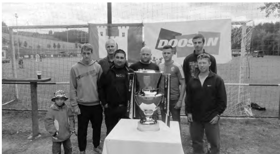
Nečtinští s mistrovským pohárem

Určitě teď to poslední, vyhráli jsme 4:1.