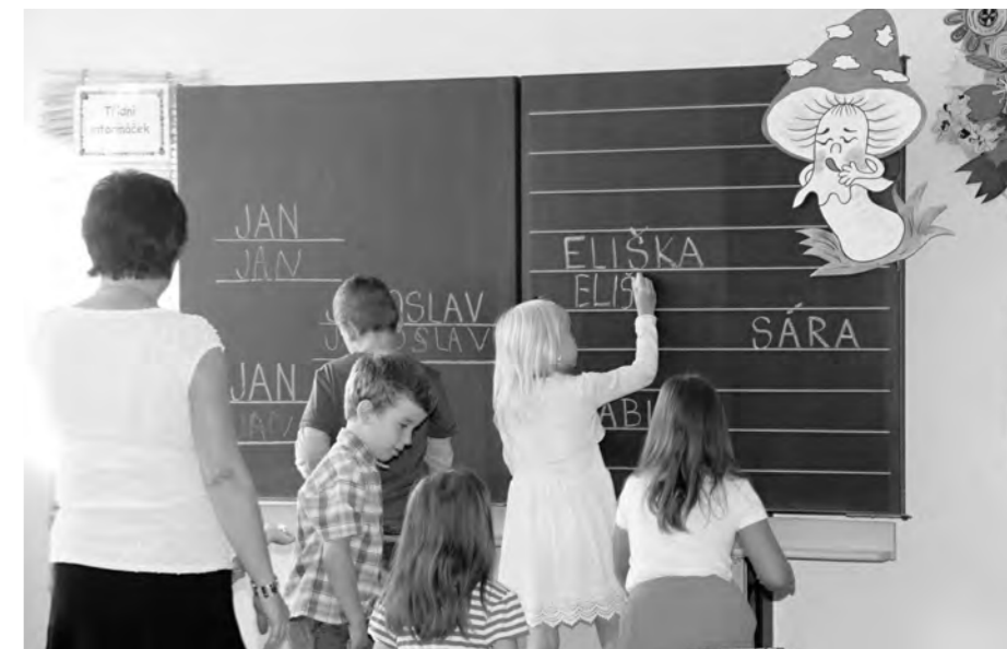
První školní den.