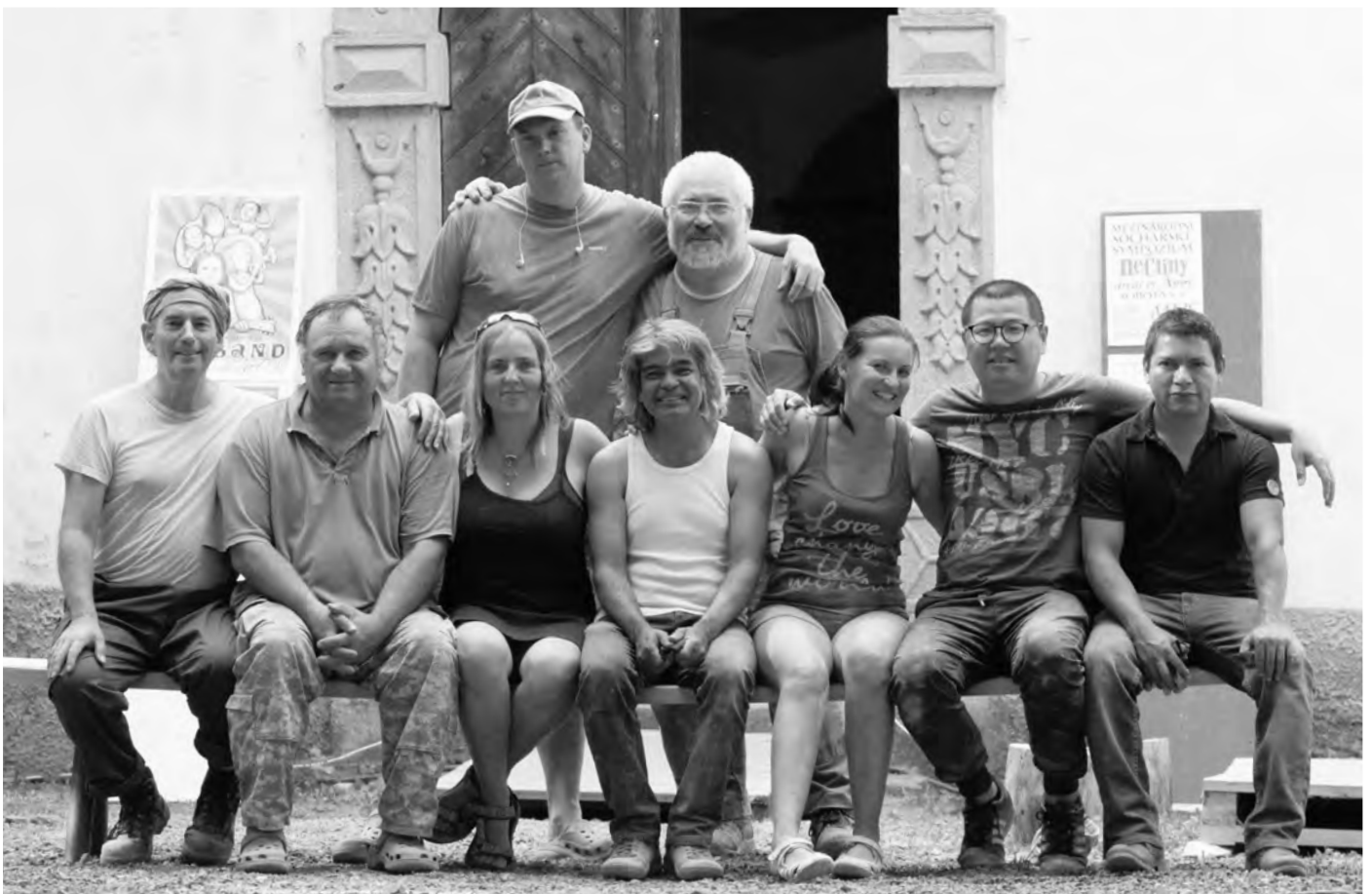
Účastníci 3. Mezinárodního sochařského sympozia.

naší obce. Cestu andělů budeme moci využívat k procházkám, zvat na ni své známé a vyprávět jim, jak se to všechno událo. Cesta se stane součástí propagačních materiálů nabízených návštěvníkům obce v našem muzeu a nočním nasvícením soch, které zastupitelstvo schválilo při poslední úpravě rozpočtu, dojde zároveň i k orientačnímu osvětlení celé cesty. To, co dobrého přinesou vytvoření andělů naší obci, to už necháme na