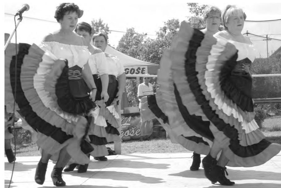
Hradecké panenky při vystoupení v Březíně.

na louce se začalo něco chystat, ale nechám se překvapit. Po malých holčičkách nastoupily na pódium ženy, které si říkají Hradecké panenky. Tancovaly na mnoho písniček a na každou měly jiný převlek. Než se připravil Prkoš, tak jste mohli ochutnat kozí sýry, zakoupit šperky, nebo se občerstvit velikými langoši. Ještě před Prkošem byla komentovaná prohlídka veteránů a následovala projížďka. Paní Majka celou pouť moderovala. Abych nezapomněla, pivo nebo limonádu jste mohli dostat i s milým úsměvem mladých kluků.