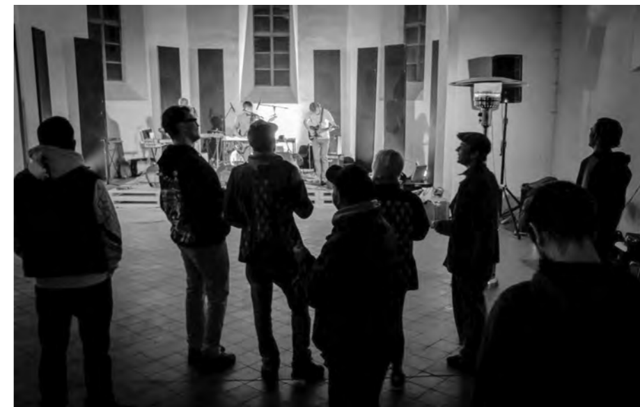
Strýčkova zahrádka ze Sušice na večeru s názvem Šumavská vlna.

i tu tajemnou hranici života a smrti. Mše sv. je tajemství, při kterém je Boží přítomnost nejintenzivnější. Mše je tedy jedním z těch nejmocnějších prostředků, jak naší láskou dosáhnout na ten „druhý břeh“. Ale můžeme říci, že jakýkoli projev touhy po Boží přítomnosti dává naší lásce „nadpřirozená křídla“, která umožní, aby „dosáhla“ na tu druhou stranu. V síle tohoto tajemství pak můžeme dohnat to, co už jsme vůči našim blízkým tady na zemi nestihli. Poděkovat, odpustit, poprosit za odpuštění... Čas „dušiček“, který