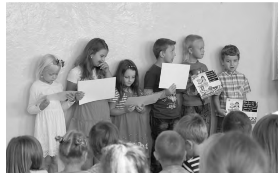
První školní den.

4. září se školáci účastnili krásného koncertu hudebního festivalu Procházky uměním, na kterém vystupovala violistka Jitka Hosprová se svými kolegy hudebníky. Koncertem