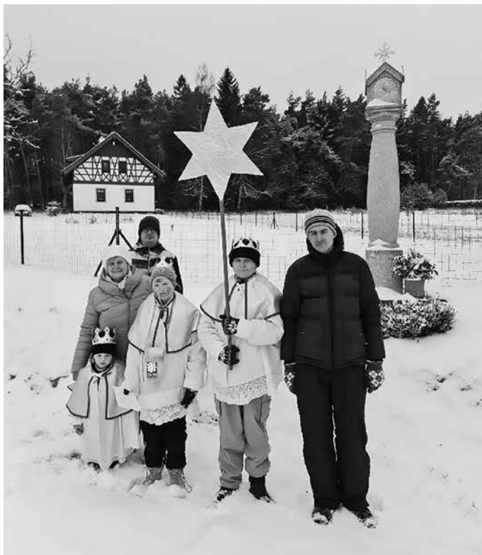
Tři králové před „Malíři II“