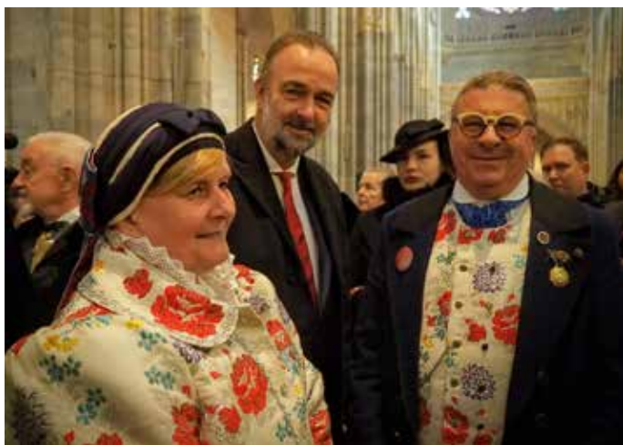
Plachtínští s králem