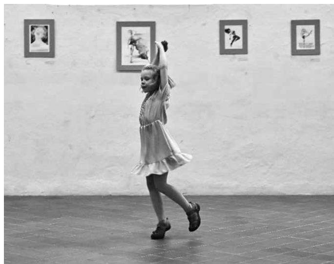
Vernisáž výstavy 40 odstínů barev