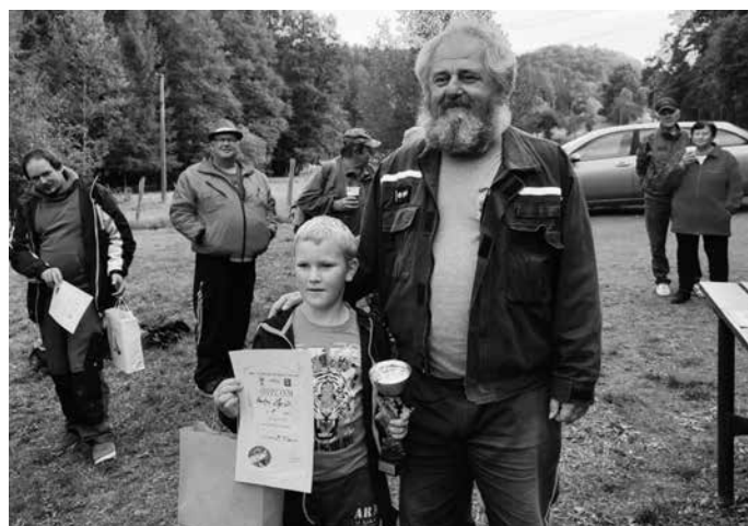
Vítěz dětské kategorie