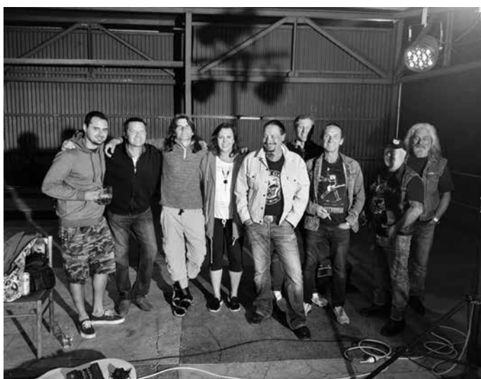
Hudební kapely COP a KNEZAPLACENÍ