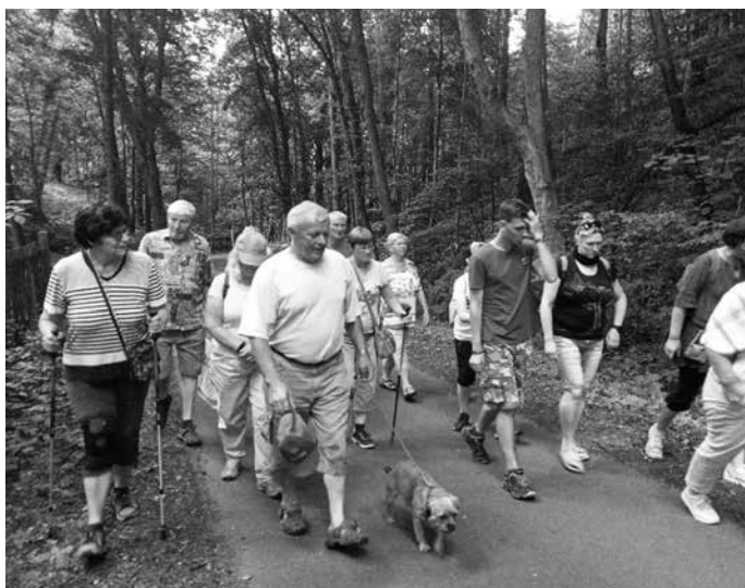
Křížem krázem Nečtinami