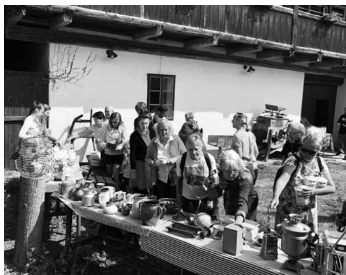
Veteš s vůní vzpomínek