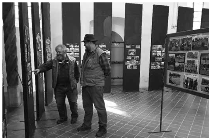
Výstava k výročí 145 let SDH