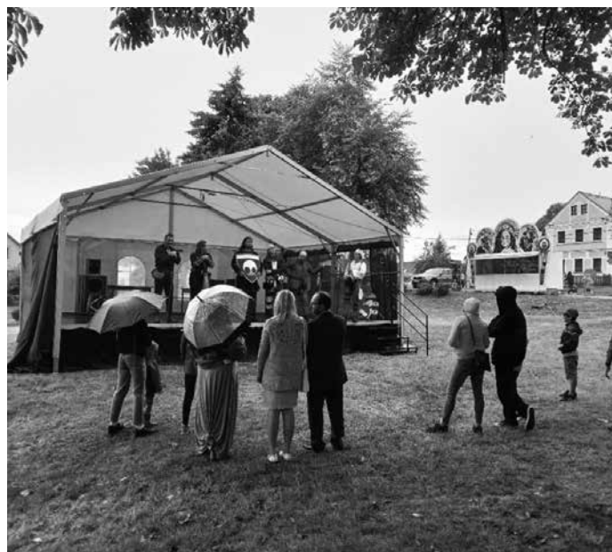
Bartolomějská pouť v Březíně