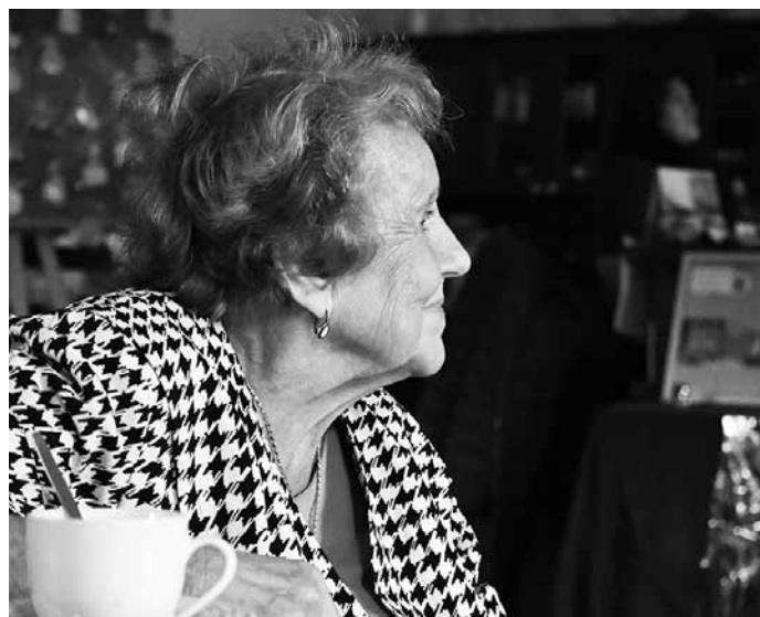
Vánoce ve světě