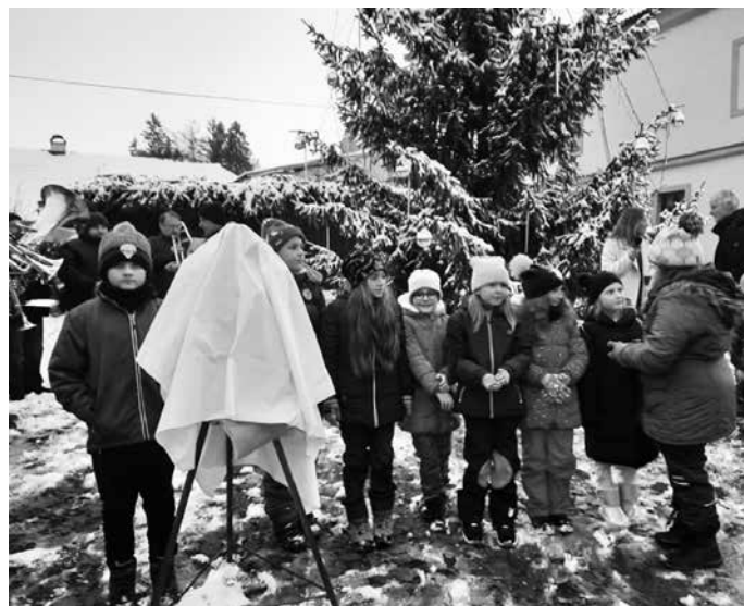
Odhaltování sošky anděla s famfárou kapely Hasičanka Teplá