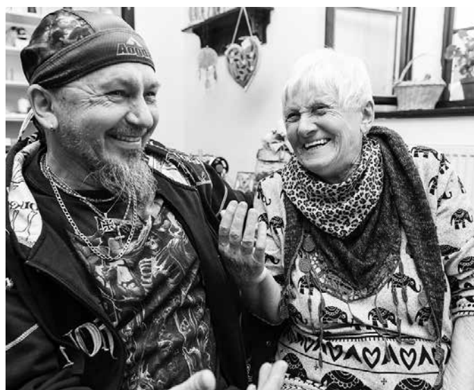
První adventní neděle