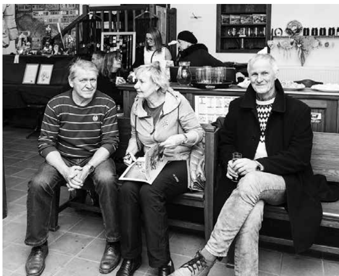
První adventní neděle