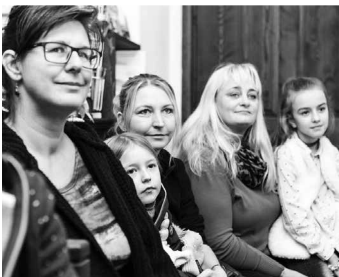
První adventní neděle