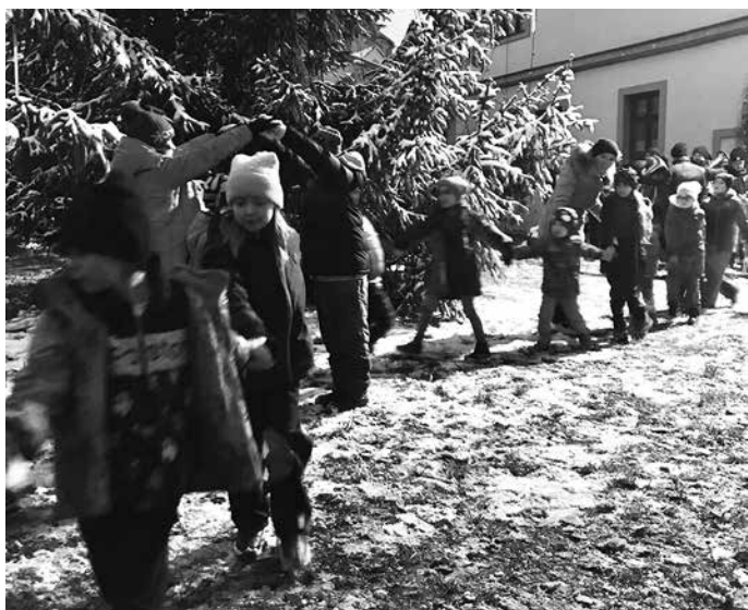
Vystoupení dětí ze ZŠ a MŠ