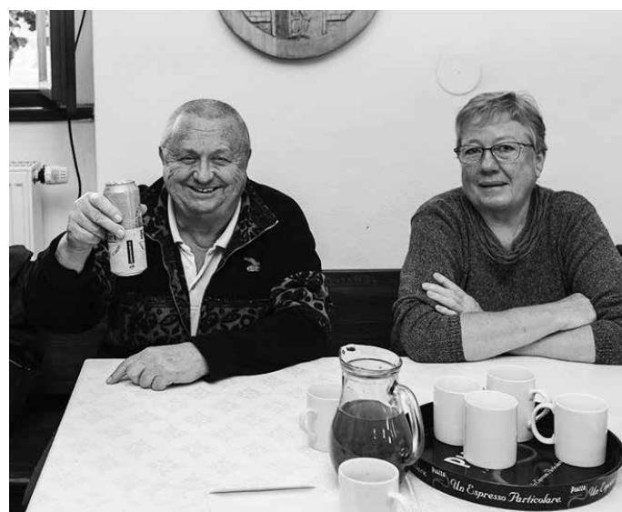
První adventní neděle