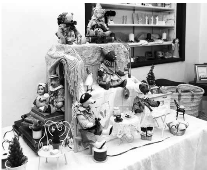
První adventní neděle - medvídci Teddy