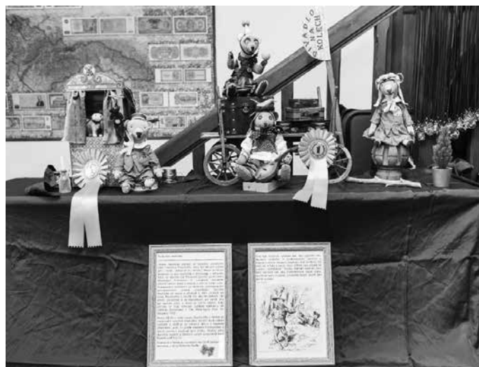
Medvídci, se kterými autorka zvítězila na mezinárodní soutěži Exhibition 2022 Doll Prague