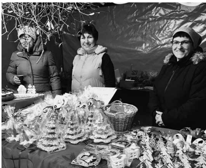
Vánoční výrobky ze ZŠ a MŠ Nečtiny