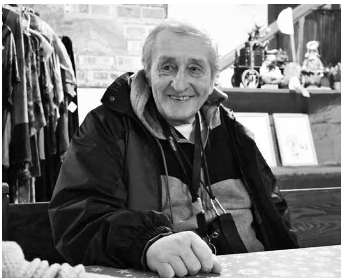
Vánoce ve světě