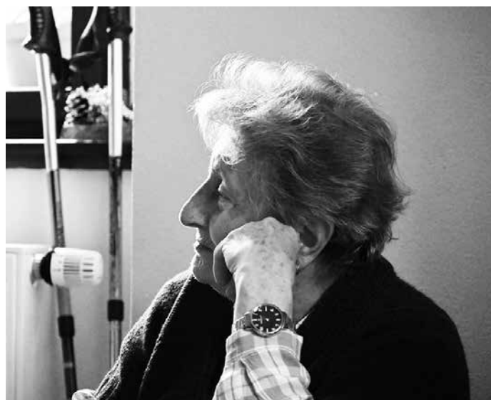
Vánoce ve světě