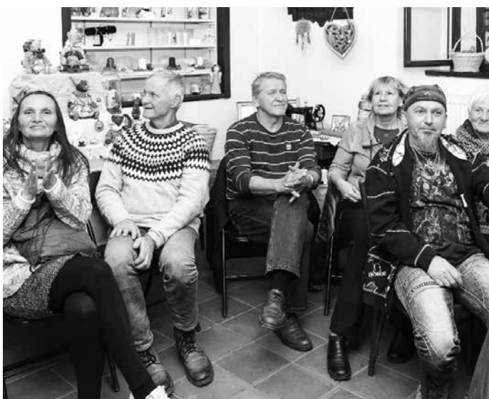
První adventní neděle