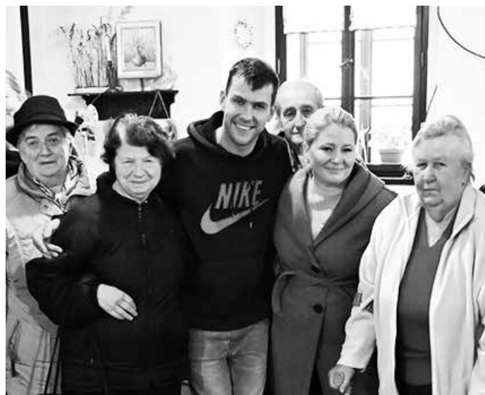
Vánoce ve světě