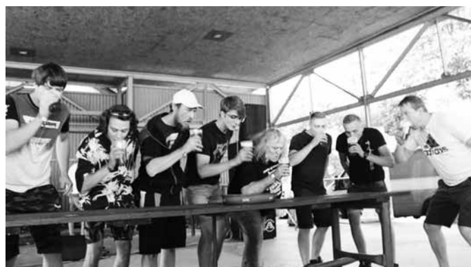
Souboj o titul pivního krále