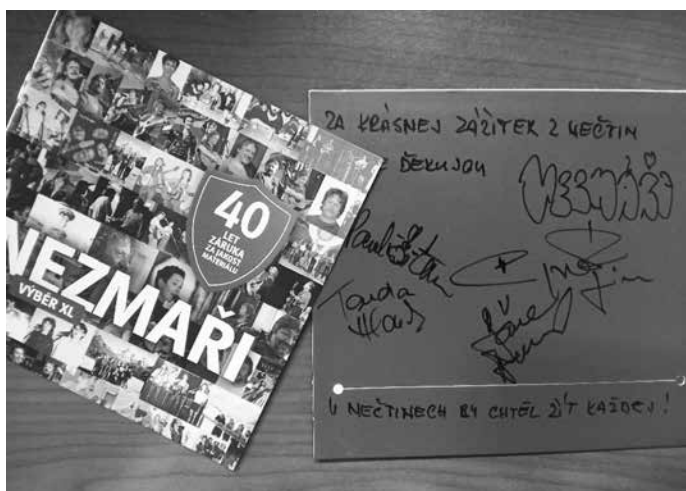
Poděkování od skupiny NEZMAŘI