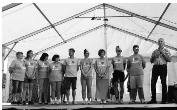
Zahájení kulturního programu