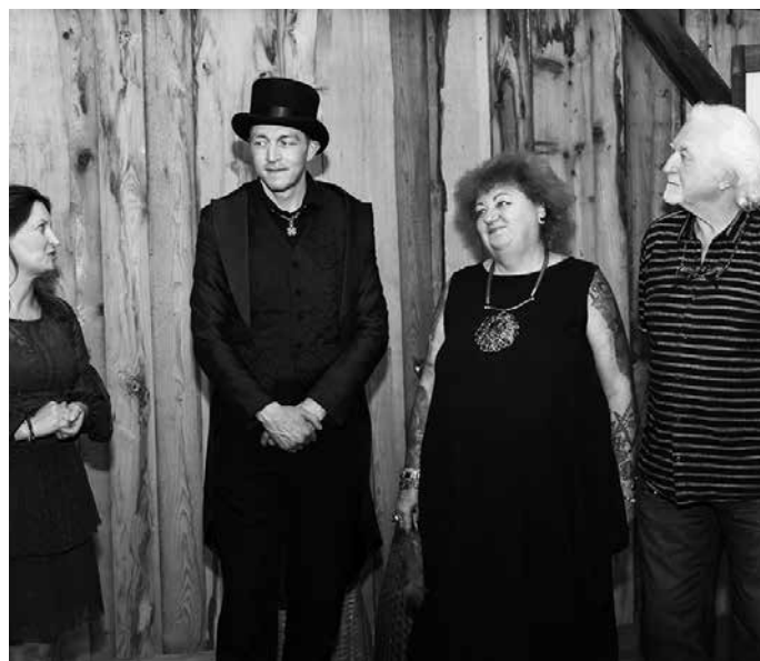
Zahájení vernisáže s autory