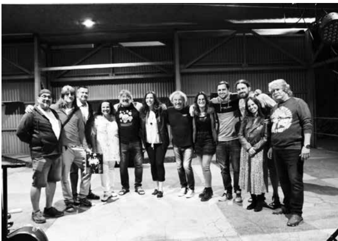
Taková ta společná pokoncertní fotka, zatímco bar čeká