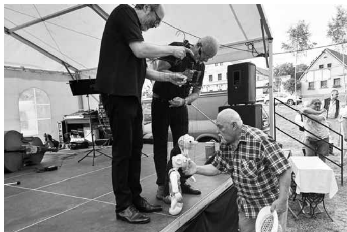
Trochu „dřeva“ a tolik něhy