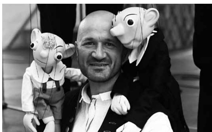
Krojovaný muzikant z MLS s loutkami aneb „Plzeňáci“