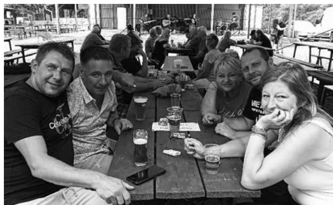
Dopoutná v neděli