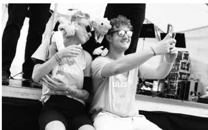
Selfie s Břežňáky