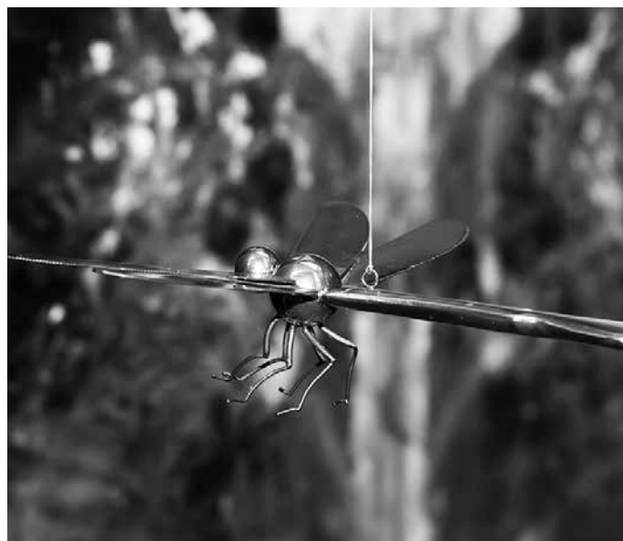
Vážka z příborů z Ateliéru Vetengl