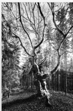
Ukázka z nového kalendáře 2024

11/ 1 2 3 4 5 6 7 8 9 10 11 12 13 14 15 16 17 18 19 20 21 22 23 24 25 26 27 28 29 30