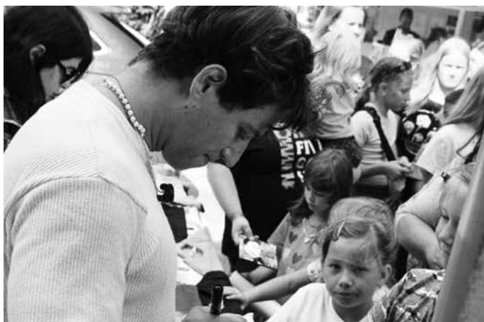
Autogramiáda s dlouhou frontou