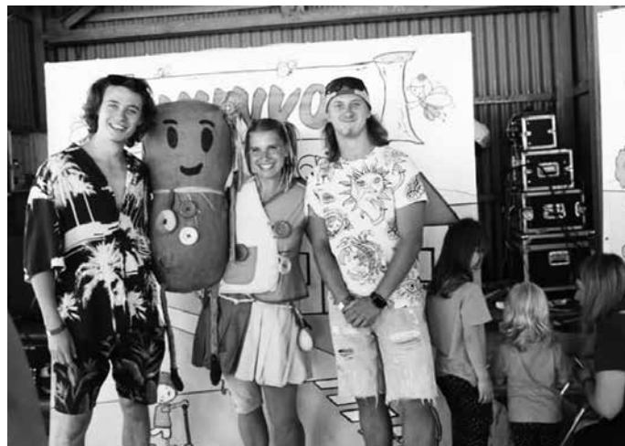
Culinka se svými obdivovateli