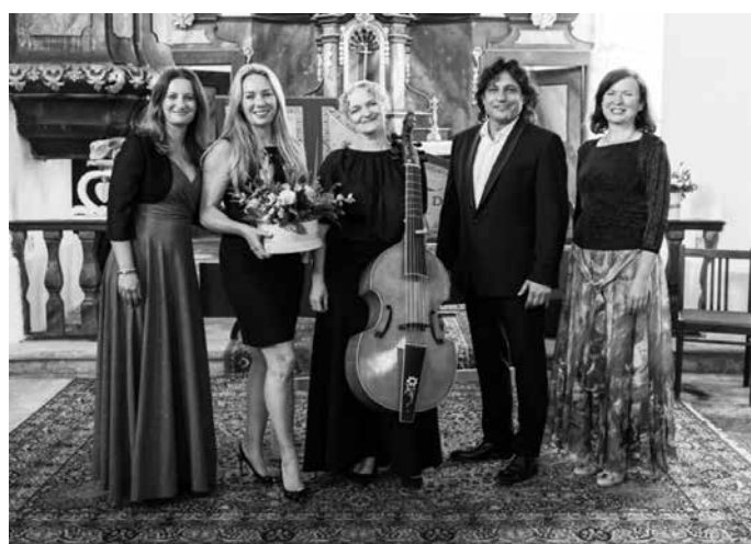
Procházky uměním 2023 – Březín – Kostel sv. Bartoloměje