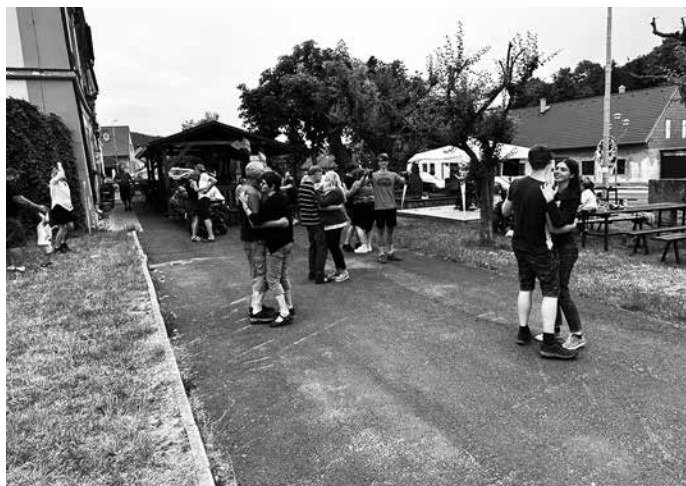
I chodník je skvělým tanečním parketem