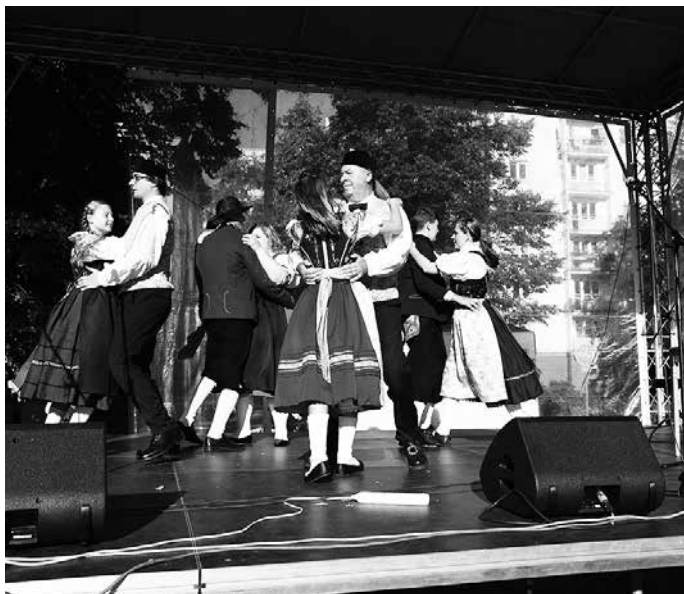
„Malíři“.