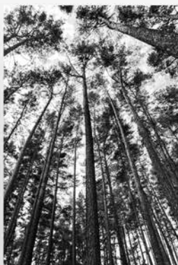
Ukázka z nového kalendáře 2024

11/ 1 2 3 4 5 6 7 8 9 10 11 12 13 14 15 16 17 18 19 20 21 22 23 24 25 26 27 28 29 30