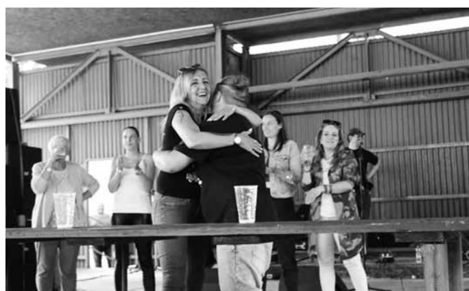
Finalistky soutěže o pivní královnu