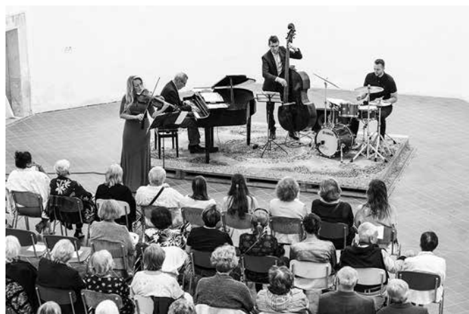
Procházky uměním 2023 – Kaple sv. Anny