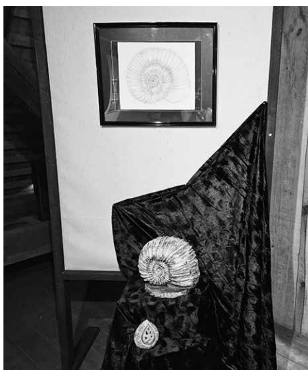
Duše ve vlnách inspirace