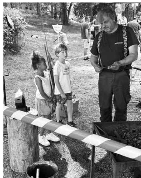
Aktivita na dětském dni