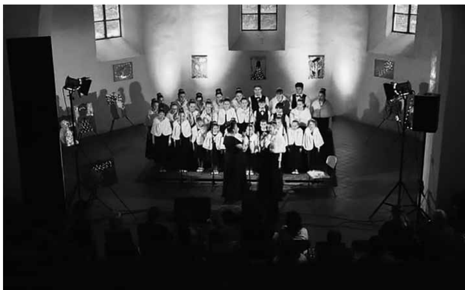
Pěvecký sbor Andílci