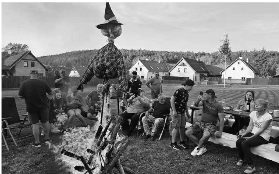
Oheň na Plachtíně s čarodějnicí