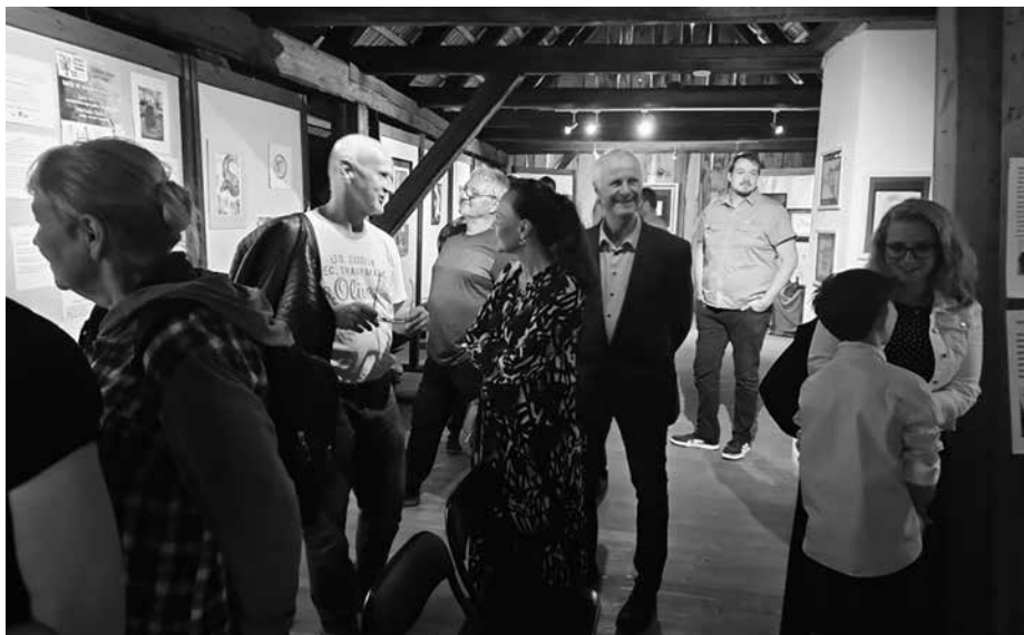
Duše ve vlnách inspirace – vernisáž