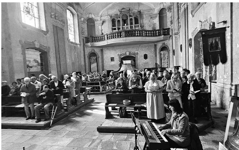
Plný kostel ve Skokách, Foto: Richard Šulko