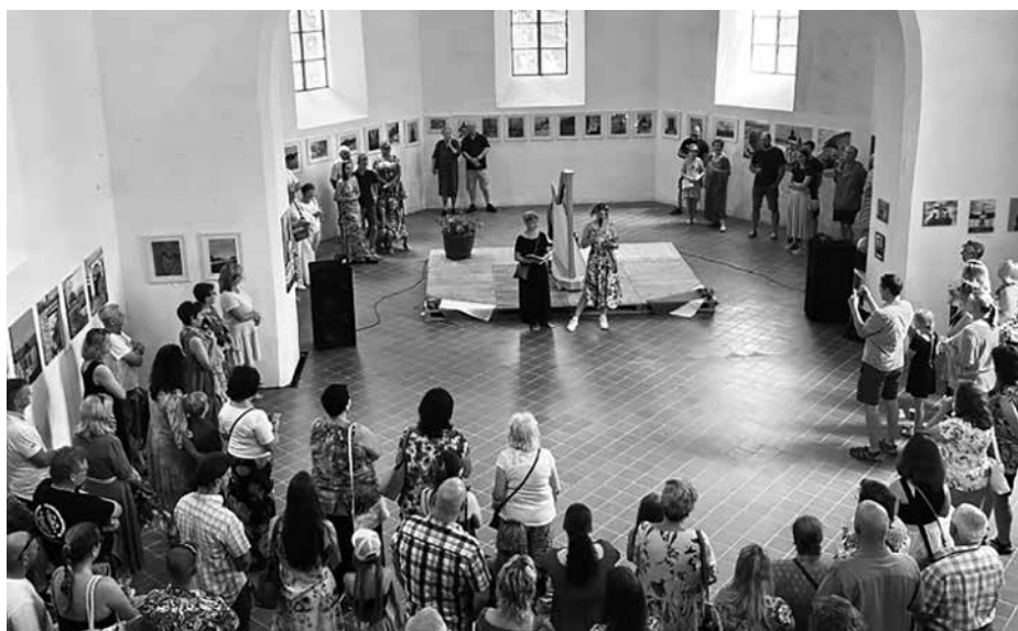
Vernisáž Malující nemalíři