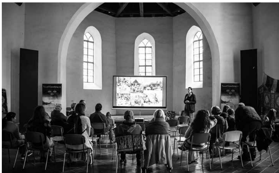
Festival letem světem s venkovem